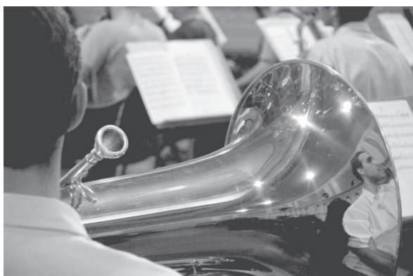
(Orquestra da UFRJ)

I. Oh, deusa da sabedoria! Tu és a minha inspiração! Nesta jornada, a estrela-guia, E deste hino, a emoção. Sou UFRJ! A educação é a minha rota. Sem temor ou preconceito, Abro o coração ao mundo inteiro!