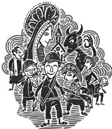
Xilogravura de Ricardo Mapurunga | Paraíba, Piauí.