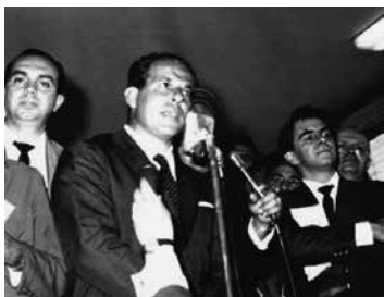
Darcy Ribeiro de braços cruzados à direita do Presidente Goulart

Os textos 1, 2 e 3, adiante, são, respectivamente, reproduções do (1) Ofício encaminhado, no dia 1º de abril de 1964, pelo então Chefe da Casa Civil do Presidente João Goulart, Darcy Ribeiro, ao Presidente do Congresso Nacional, Senador Aldo de Moura Andrade, lido na sessão do Congresso que destituiu, ilegalmente, o presidente Goulart; (2) do trecho final do discurso do Presidente do Congresso Nacional, Senador Aldo de Moura Andrade, que, em apoio ao golpe civil-militar, declarou vaga a Presidência da República; e (3) de matéria publicada na edição digital do Jornal do Senado, em 19 de dezembro de 2013. Leia-os atentamente e responda às questões 14, 15 e 16 a seguir.