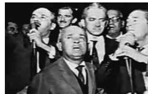
Deputados indignados aglomeram-se diante do microfone de apartes.

“(…) Atenção! O Sr. Presidente da República deixou a sede do Governo. Deixou a Nação acéfala. Numa hora gravíssima da vida brasileira, em que é mister que o Chefe de Estado permaneça à frente do seu governo...abandonou o governo. E esta comunicação faço ao Congresso Nacional. Esta acefalia configura a necessidade do Congresso Nacional, como poder civil, imediatamente, tomar a atitude que lhe cabe, nos termos da Constituição brasileira, para um fim de restaurar nesta Pátria conturbada a autoridade do Governo e a existência do Governo.